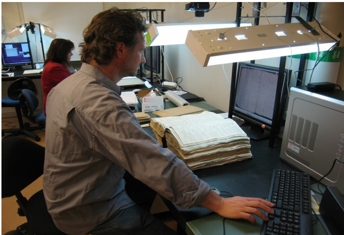
Arkiv Digitals medarbetare vid produktionsanläggningen i Göteborg

Vid utgången av år 2007 hade bolaget 12 anställda (sju män och fem kvinnor).